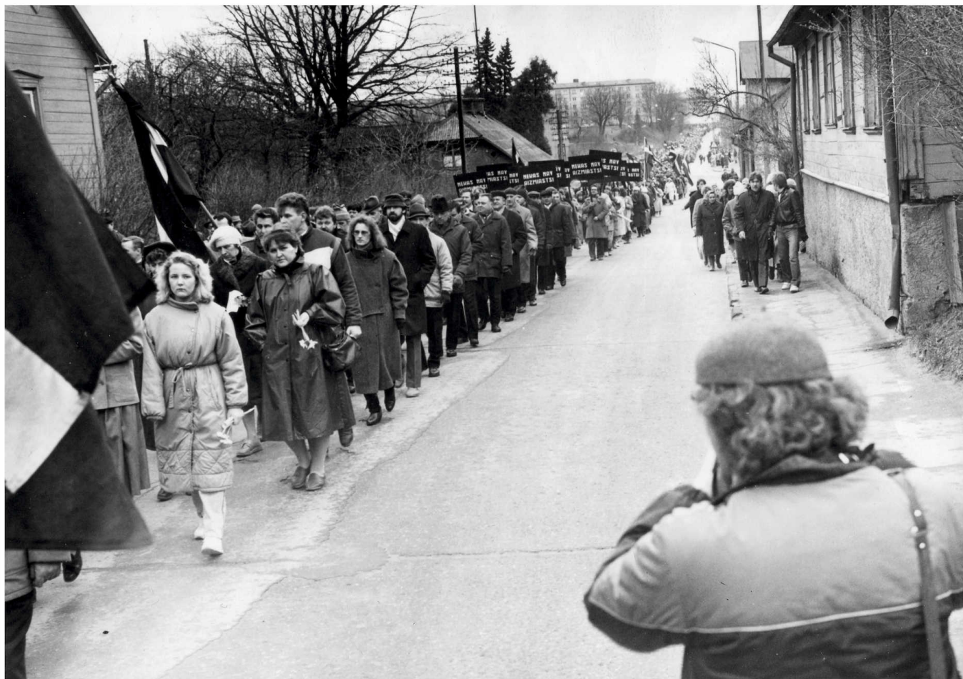
Stalinisma represiju upuru piemiņas gājiens uz Valmieras dzelzceļa staciju. 1989. gada 25. marts.