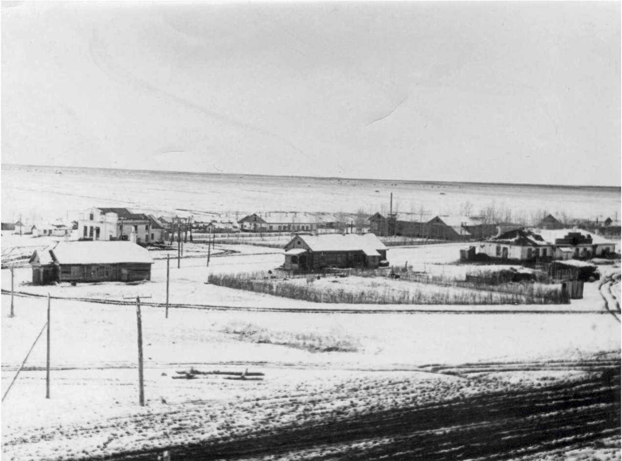
Nometinājuma vieta - Nazarovkas sādža, Belogorskas rajonā, Amūras apgabalā. 1956. gads.