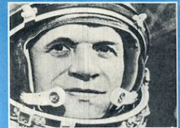
PSRS pirmais kosmonauts Padomju Savienības Varonis ALEKSEJS GAGARINS.