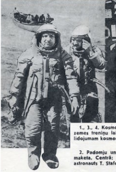
1., 3., 4. Kosmonauti A. Leonovs un B. Kubasovs jūras un sauszemes treniņu laikā, gatavojoties padomju un amerikāņu kopējam lidojumam kosmosā. 2. Padomju un amerikāņu speciālisti pie savienošanās mezgla maketa. Centrā: grupas vadītājs V. Šromajņikovs un amerikāņu astronauti T. Stafords.

— Fantastisk! Satricēš! Lielisks triumfs! — Šādi vārdi pildīja avižu pirmās lappuses.