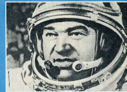
PSRS pirmais kosmonauts Padomju Savienības Varonis GORGOŠINS GREGORIJS.