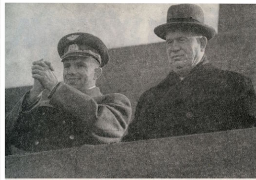
Padomju valdības galva NIKITA HRUSČOVŠ un kosmonauts JURIS GAGARINS.