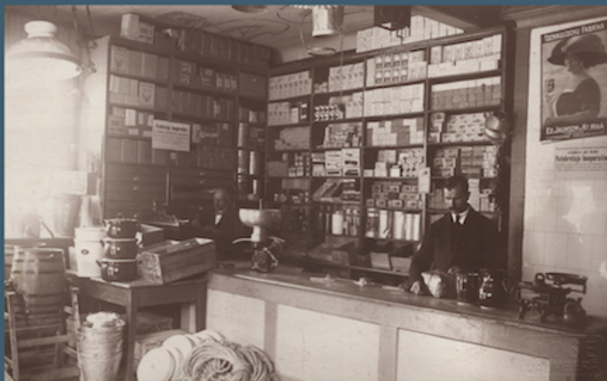
Amatnieku kooperatīva veikala Valmierā iekšskats, 1927.g. Labajā malā - cigarešu reklāmas plakāts