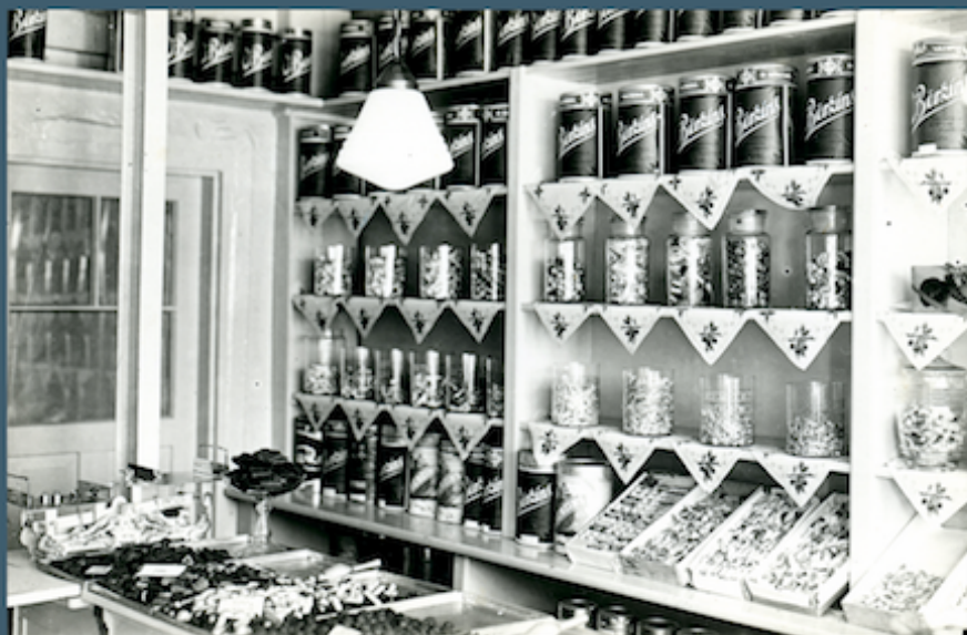
Konfekšu rūpnieka Oskara Bērziņa veikala iekšskats Valmierā Rīgas ielā 1