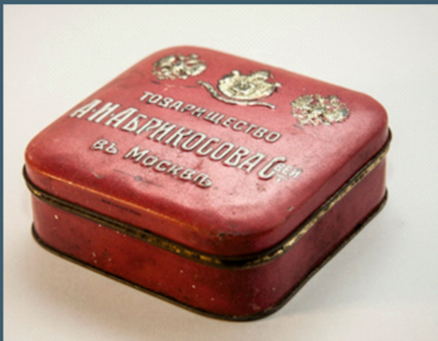
Konfekšu kārbā ABRIKOSOV no Jelgavas muzeja krājuma

Par augsto produkcijas novērtējumu un godalgu saņemšanu izstādēs A. Abrikosova un dēlu akciju sabiedrība ieguva tiesības uz savu izstrādājumu iepakojuma izmantot Krievijas Impērijas gan mazo, gan lielo ģerboni, zem kuriem ir arī norādes – gadskaitļi, kad godalga saņemta.