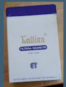
Cigarešu kārbas, padomju periods, 20.gs. 70. - 80.gadi