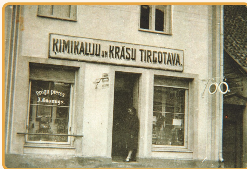
Jāņa Gaumiga dažādu preču veikals 20. gs. 30. gados atradās Rīgas ielā 19. Attēlā Gaumiga kundze 30. gadu beigās (VINM 45782).

VEF produkcijas pārstāvji radio uztvērējiem līdzī daļu rūpnīcas garantijas pasi un lietošanas pamācību.