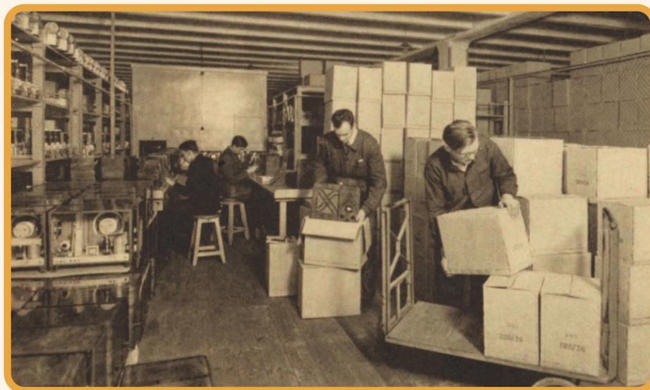
VEFAR 2MD/35 dodas ceļā pie pircējiem.

Šo modeli ražoja 1934.–1935. gadā. Tas bija vienkāršs, kvalitatīvs, ērts un salīdzinoši lēts – tikai 125 latī.