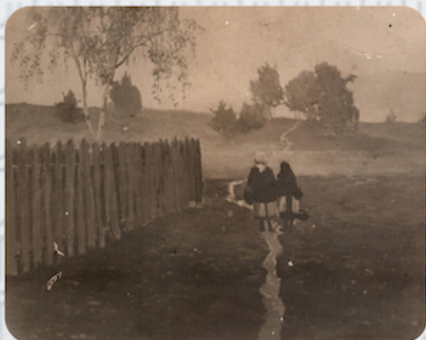
A. Petrova fotoreprodukcija darbam „Rīta saule”, foto ap 1920.g.