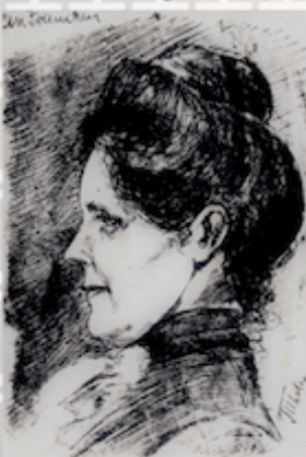
Mākslinieka sievas portrets.