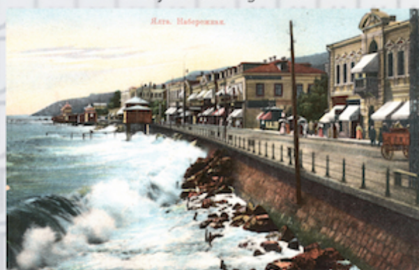
Jaltas krastmalas rajons, kur Piekrastes ielā dzīvoja T. Ūdera ģimene.